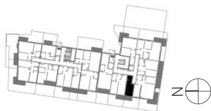
↑ RZUT KONDYGNACJI ← MAPA OSIEDLA

Rzut i powierzchnia apartamentu w dalszym etapie projektowania może ulec zmianie w granicach ± 2%. Na wszelkie zmiany należy uzyskać zgodę projektanta. Nie dopuszcza się zmian elewacji budynku. Nie dopuszcza się wkładania podejść instalacyjnych w ściany międzyokratowe.