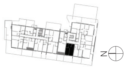
↑ RZUT KONDYGNACJI ← MAPA OSIEDLA

Rzut i powierzchnia apartamentu w dalszym etapie projektowania może ulec zmianie w granicach ± 2%. Na wszelkie zmiany należy uzyskać zgodę projektanta. Nie dopuszcza się zmian elewacji budynku. Nie dopuszcza się wkładania podejść instalacyjnych w ściany międzyokratowe.