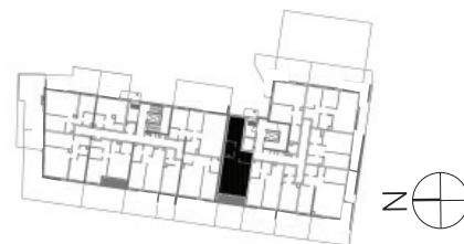
↑ RZUT KONDYGNACJI ← MAPA OSIEDLA

Rzut i powierzchnia apartamentu w dalszym etapie projektowania może ulec zmianie w granicach ± 2%. Na wszelkie zmiany należy uzyskać zgodę projektanta. Nie dopuszcza się zmian elewacji budynku. Nie dopuszcza się wkładania podejść instalacyjnych w ściany międzyokątowe.